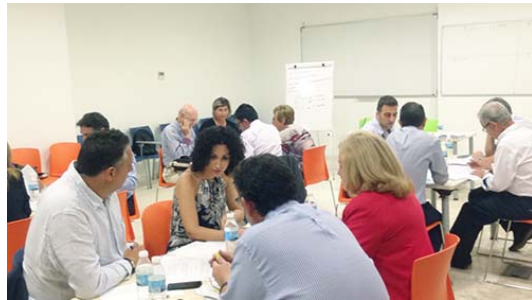
Reuniones de los Grupos Motores Locales de Almería, Martos, Cádiz y Palma del Río