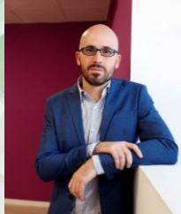
Ignacio Álvarez Peralta

Secretario de Estado de Derechos Sociales. Gobierno de España