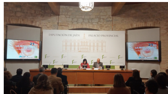
Jornada sobre IA organizada en colaboración por la Diputación de Jaén y la Fundación Ageing Lab el 21 de febrero.

temática generó un intenso debate sobre la utilización de esta tecnología y la necesidad de aondar en su conocimiento por parte de las Entidades Locales.