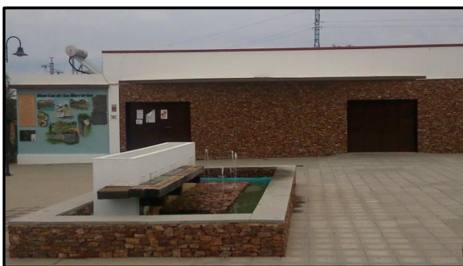
Mural acabado y su entorno

una parte importante de la población de las Herrerías, unos aportando materiales que vienen directamente de los huertos como “la zaranda”, que hacen la obra más destacable por ser una técnica mixta y por haber en ella parte de su huerto, parte de sí.