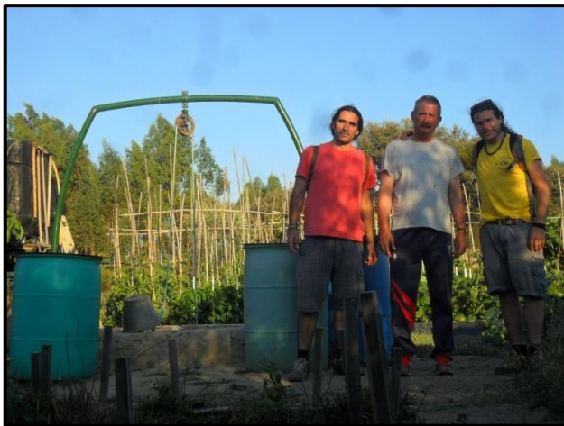
Miembros de la asociación Matilde junto al propietario de un huerto y su pozo.

Al igual que la primera fase, esta comportaría dos actividades principalmente. La primera fue una investigación etnohistórica y etno-ecológica de los huertos de La Herrería, desarrollada de modo participativo, a fin de inventariar y catalogar los huertos históricos de Herrerías, nos obstante, dada la necesidad de plasmación de la información en un formato que crease sensibilización a lo largo del tiempo, se puso en marcha la segunda actividad llamada ¿Qué nos cuentan los huertos?, con la que se realizó un mural en el que volcar la información y hacer que la comunidad local se implicara en su ejecución.