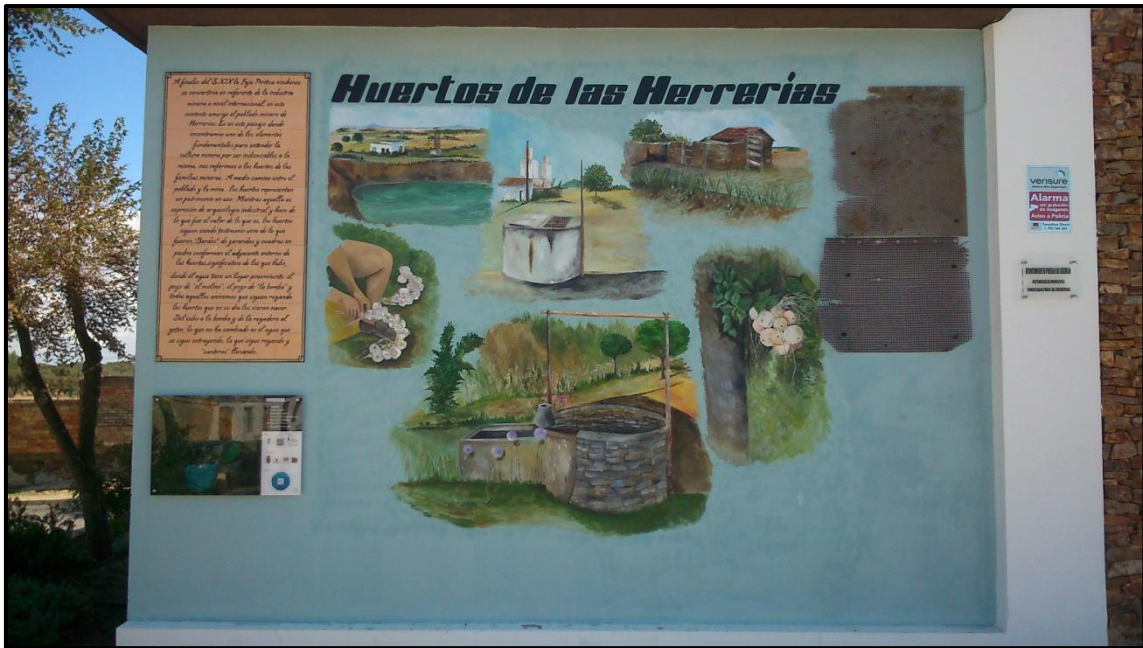
Mural colaborativo en técnica mixta

hecho de ella. Finalmente, destacar el papel que juega en el éxito de proyectos de estas características el trabajo con equipos compuestos por profesionales de diversas disciplinas tanto de las ciencias naturales como sociales y, sin perder de vista, las aportaciones del conocimiento local, básico si queremos que la perspectiva holística haga su aportación.