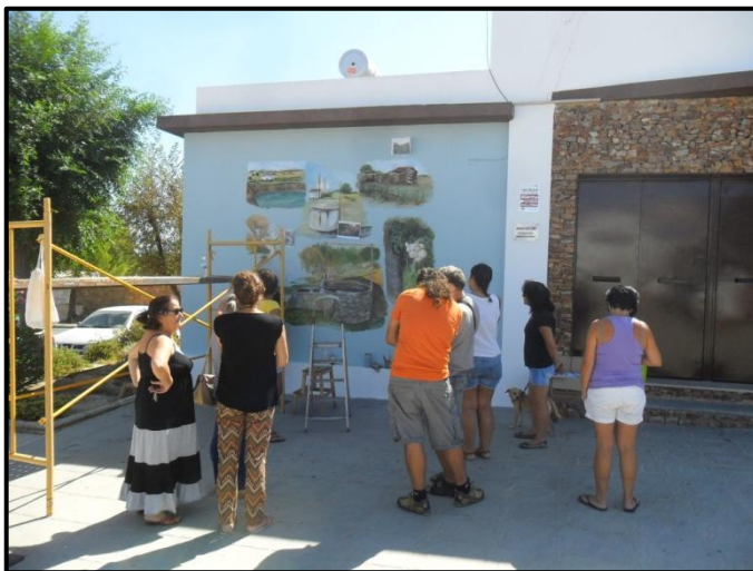
El mural en primera fase de ejecución

Ayuntamiento de la Puebla de Guzmán, entre todo el equipo de profesionales que ha estado tras el proyecto. Del mismo modo, cabe destacar la ejecución del mural, ya que ha sido una intervención artística que ha de distinguirse, no sólo por los aspectos artísticos, que los tiene ya que para ello contamos con la aportación de profesionales de la pintura y cerámica de la localidad, que monitorizaron la tarea, lo cual es un doble enriquecimiento al aportar desarrollo local al haber sido contratados sus servicios profesionales, sino también por haber sido una obra colectiva en la que ha participado