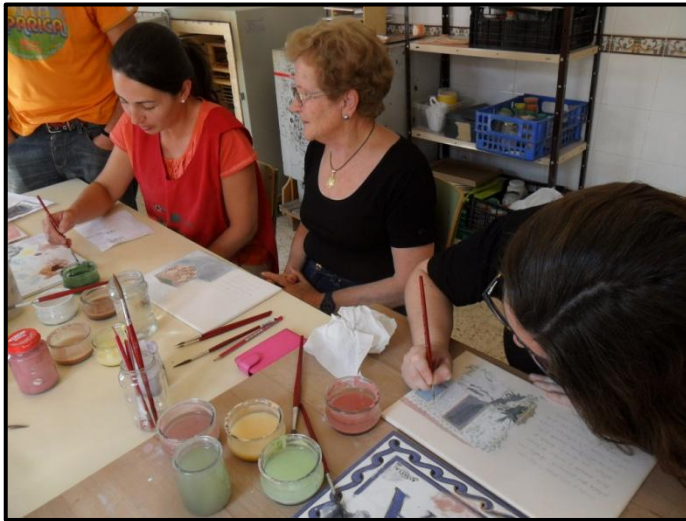
Taller de los azulejos de "la ruta de los pozos"

Hemos de señalar que hay dos cuestiones que hacen destacable el trabajo realizado por encima de la materialización artística del resultado, en primer lugar, la importancia de hacer que el municipio tome conciencia de un elemento que por ser