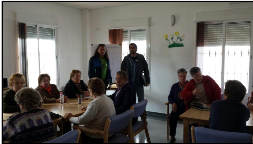
Encuentro informativo con los mayores de la localidad

Una vez realizado el inventario, se seleccionaron 14 pozos que han sido los que han formado parte de la que hoy es “La ruta de los pozos” de la Puebla de Guzmán y que se