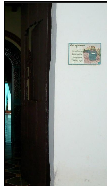
Plano y algunos pozos de la ruta en una exposición (arriba) y azulejo colocado en la fachada (derecha).